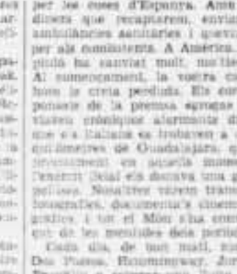
JOHN DOS PASSOS