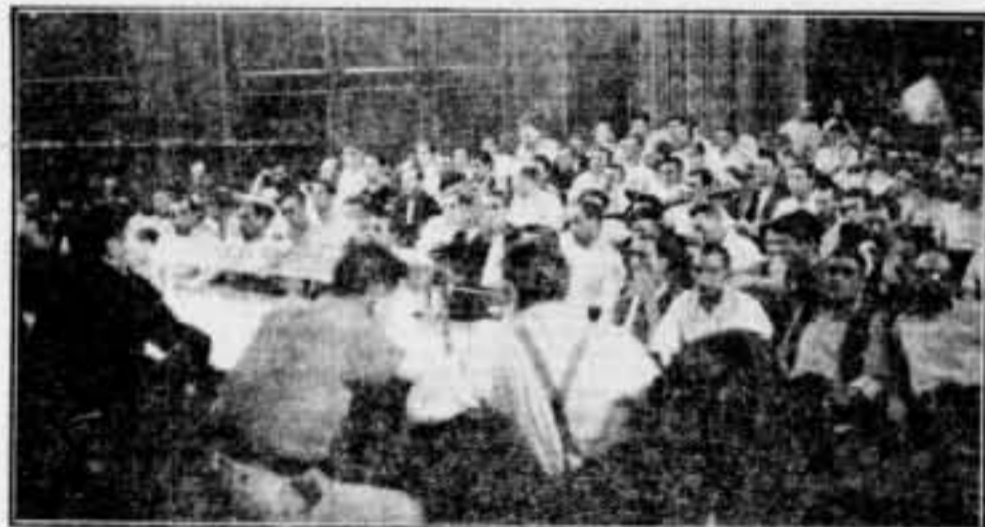
En un dels camps d'actes de la Cruz C. N. T. C. A. T. durant la celebració de la primera sessió del Ple Regional de Campesins. (En primer terme la tribuna de discursos)

El vaixell alemany ambic ha empenyat els "bous" que es construïen a arrossegat mines en el lloc on fa uns quants dies, va destruir unes mines "H. 30" va topor amb una mina. Dos d'aquests vaixells, per tal de soterrar a l'agressió, han embarrancat a la platja de Pe-