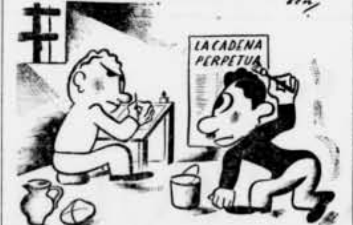
Els periodistes engabiats s'entreenen

El nostre fortificadora es dedicava arduament a convertir en obstacles infranquejables les posicions arribades tan brillantment a la fecció. Cal remarcar als heroics soldats republicans del preparat per tot que document dels esforços portats a terme.