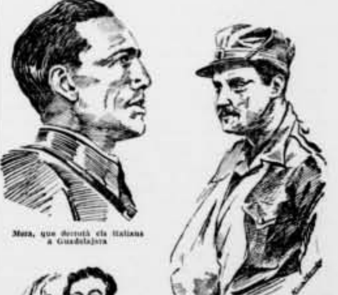
Mera, que derrotà els italians a Guadalajara