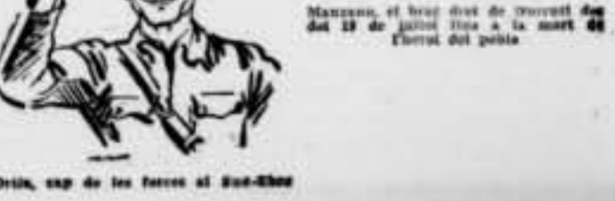
Mansueti, el braç dret de Durutti des del 19 de juliol fins a la mort del Euzkadi del poble