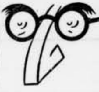
Si Campalans visqués, què li diria?

¿Qui és aquell col·laborador del "Secretari" que, ultra no anar al front, encara hi comença els familiars?