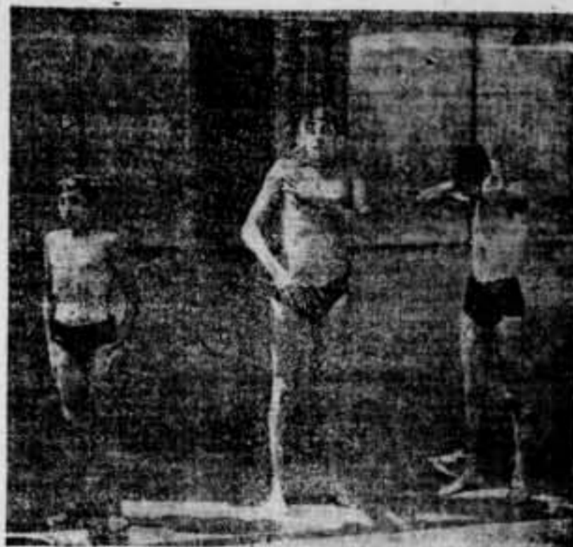
Després del treball, la dutxa

Els tallers d'aquesta indústria han estat sanejats talment, que avui els treballadors del ram de la fusta no-