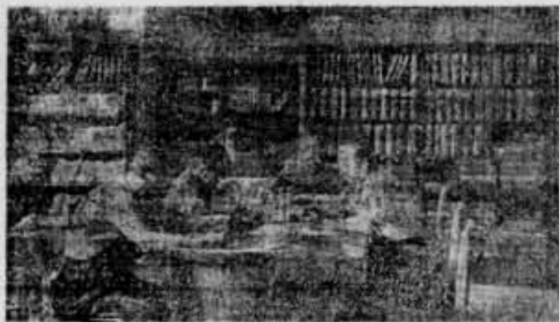
No solament hi ha higiene i esbarjo. Els tallers socialitzats compten amb una biblioteca excel·lent