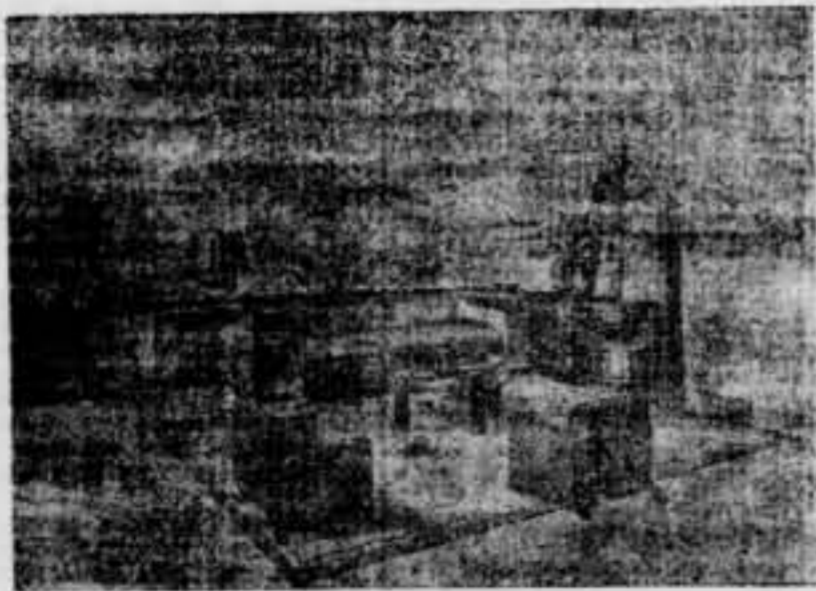
Un bell projecte realitzat per la Indústria Socialitzada de la Fusta C. N. T.

I mentrestant, el enastimes enerra milions i milions a fer la guerra al poble espanyol i en fabricar municions que servirán per a fer una guerra més gran a tots els qui sentim una gota de l'ànima a la democràcia.