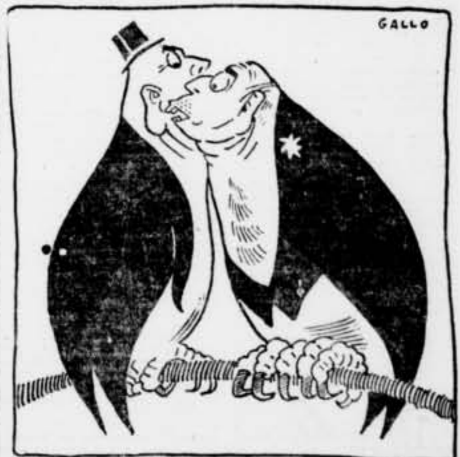
No sempre porten frac, però sempre tenen notícies «secretas» per escampar

Trecha, llançant gran nombre de trets de morter.