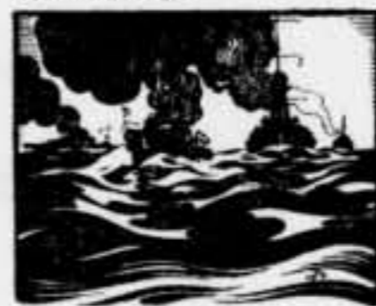
Dibuix que l'artista executat en el vidre

També és un altre dels nostres propòsits fer arribar al coneixement dels més profans com es desenvolupen les indústries, procurant explicar-ne compendiadament el tecnicisme. No és pas un reclam a una glossa — que cap falta no fa — el que penso escriure com a reportatges; és quelcom més consistent, més sòlid: desvetllar consciències i instruir ignorants. Tasca ingrata i feixuga.