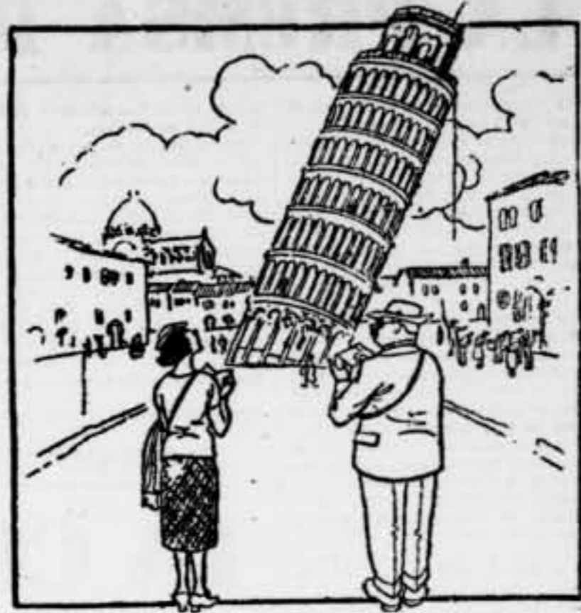
— Ja està bé, ja. Però, amb tot, algú n'hauria de parlar amb Mussolini de tot això.