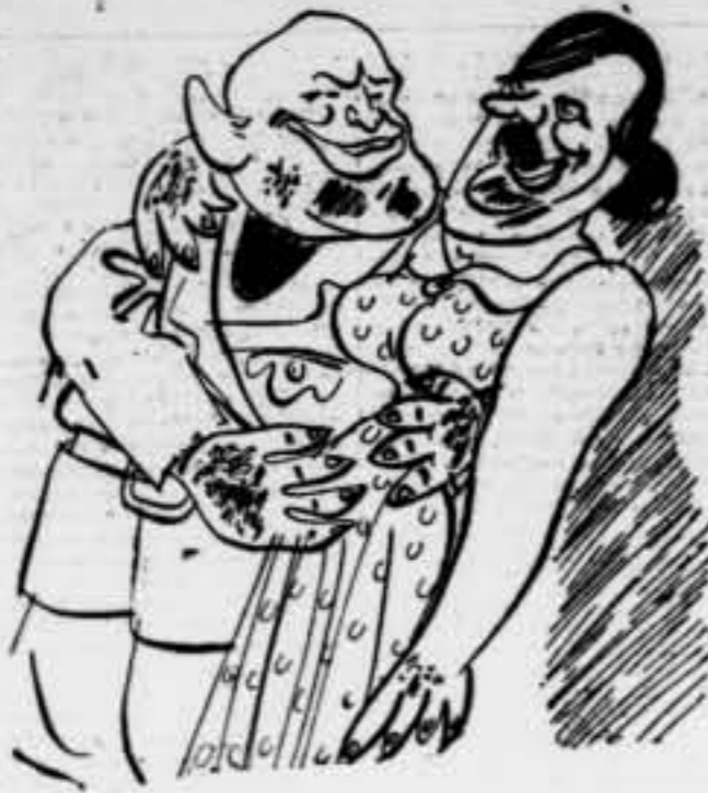
No m'oblidaràs, Benet...? No, Mai! Ho he declarat públicament.