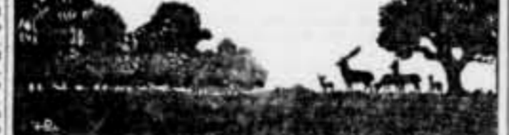
Vista de muntanya. — Per a exercitar, sem l'anterior.