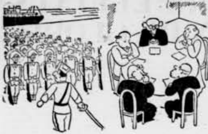
El Comitè de Neutrals (?) i res de voluntaris; gent que vingué per força