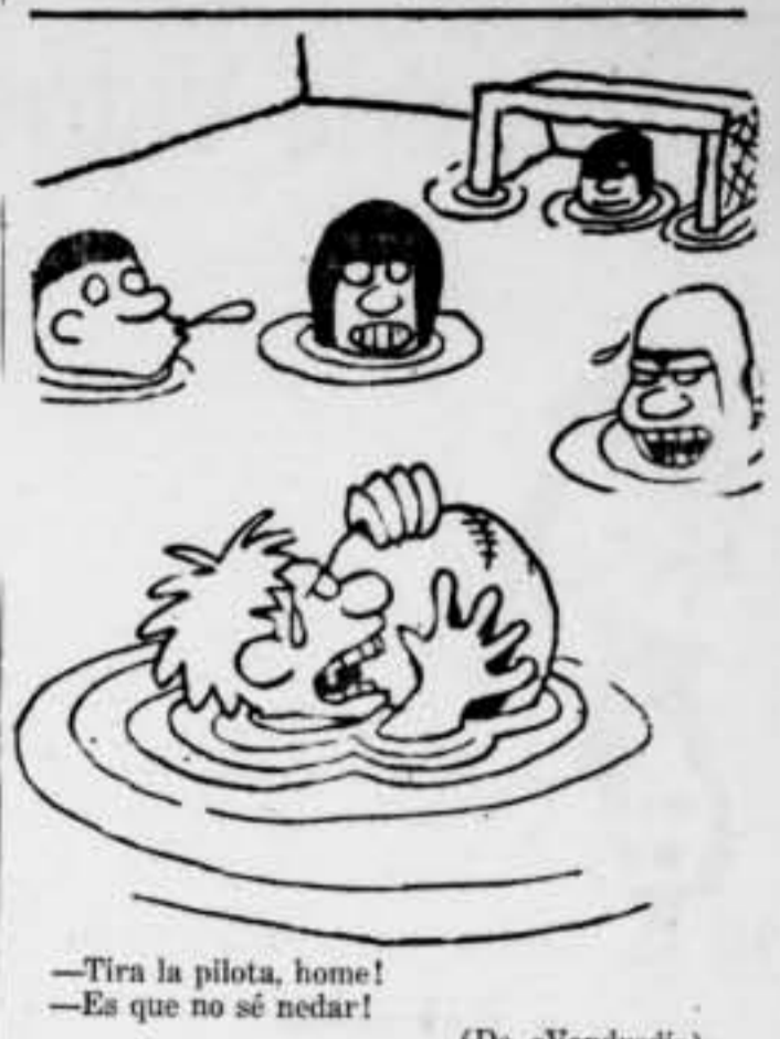
—Tira la pilota, home! —Es que no sé nedar! (De «Vendredi»)