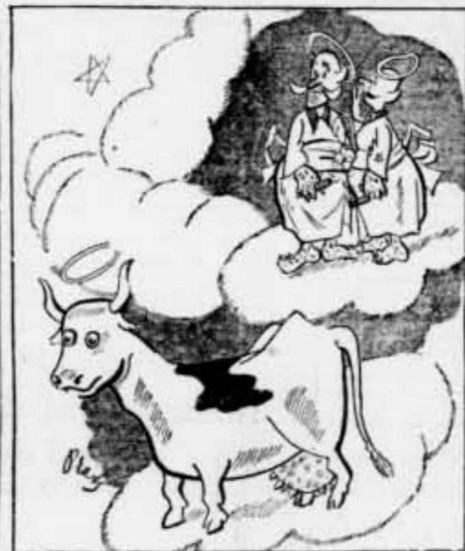
— Què hi fa aquesta vaca, ací?... — És per alimentar la via lactia...