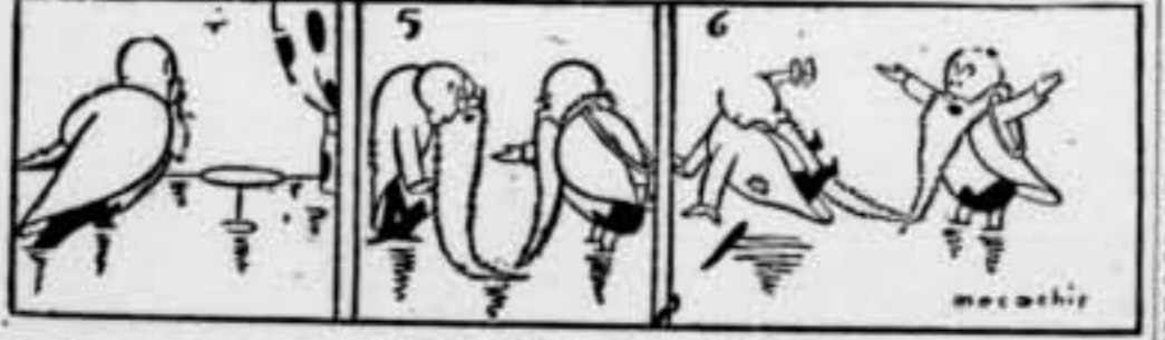
L'ORDENANÇA (que ja és molt vell). — ¿Per què no us moveu mai d'aquí?