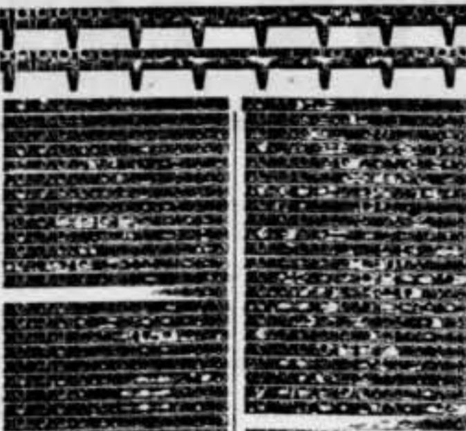
EL PRESIDENT COMPANYS TE ENCARA UNA MICA DE FEBRE