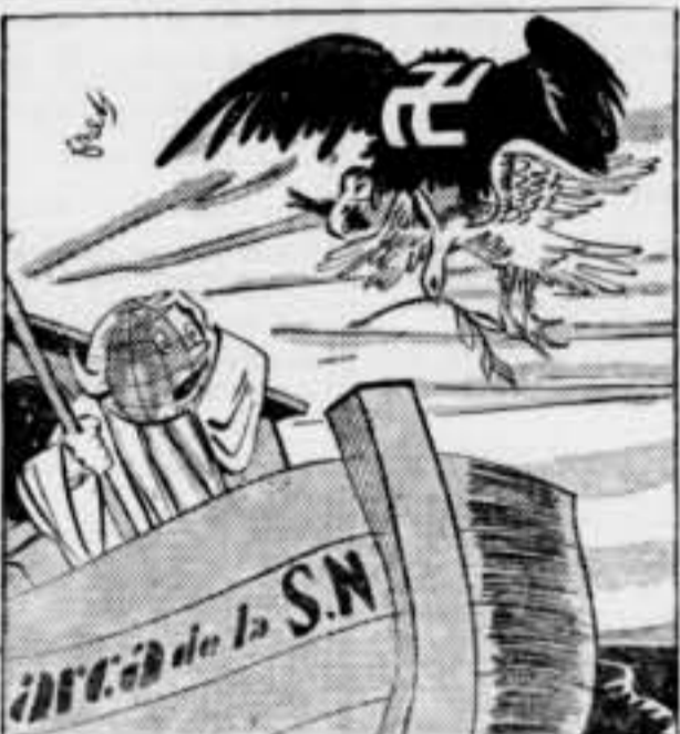
El Món. — Redeu! Cada dia ho veig més negre.