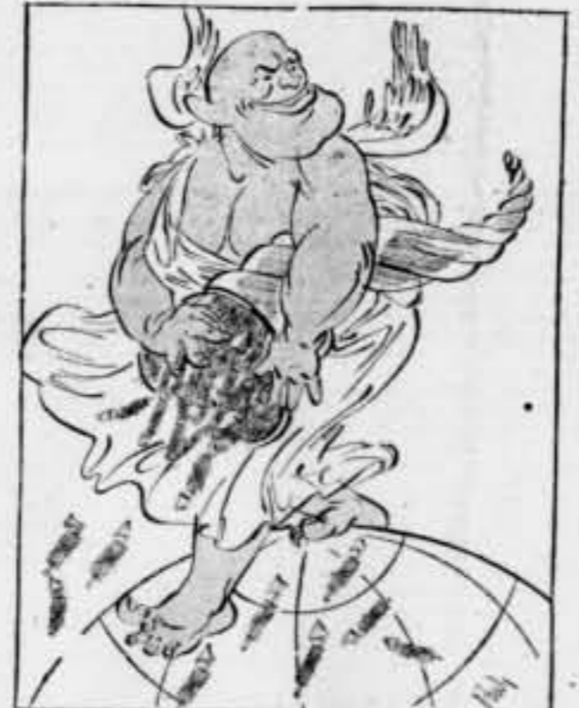
Sembrant feixisme. Nota del caricaturista: ¿I el proletariat espanyol? Que no compta?