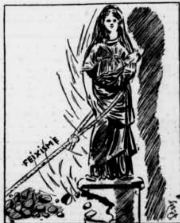
Si estiren una mica massa, cau i es trenca