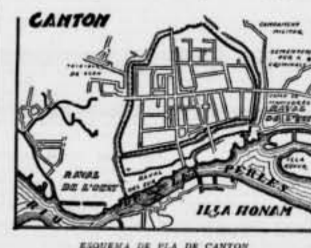
ESQUEMA DE PLA DE CANTON

traran a Canton els espanyols. Aquesta oportunitat realment les condicions favorables de la ciutat per al comerç de Filipines. Hi treballaven diverses comunitats religioses, com era d'esperar. Els espanyols obtingueren bons negocis a Canton. Darrera seu hi van posar petja els holandesos i, finalment, els anglesos. L'any 1677 se suspengué el co-