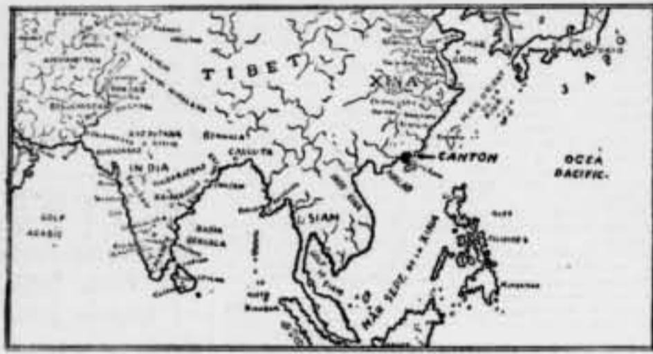
ESQUEMA DE MAPA DE L'ÀSIA MERIDIONAL

Es un fet que la vida comercial de Xina s'ha anat desplaçant cap a l'est. Xang-Hai és el mirallot que atrau tota la rodadura i tota la vida comercial. Té molta atracció. Molta més que no l'ha tingut ni en tindrà mai Canton. Malgrat tot, equivoques desplaçament de la vida comercial no fa de fer cause Canton del tot. El que ha fet ha estat reduir el paper de les pròpies possibilitats, al de porta comercial de la Xina del Sud. En lloc d'ésser l'únic port, l'única via d'expansió, passà a representar el paper natural, el que per la regió a la qual servia havia de correspondre-li. Els anglesos hi cooperaven perfectament. Potser millor que no els pròpies xinesos. Canton té vida pròpia. En aquest moment de lluita agitant en terra xinesa, és ho de recordar-ho. Qui sap si la vitalitat de Canton i la de la zona del riu Si-Kiang donaran els xinesos una possibilitat i una font d'ingressos que en les circumstàncies actuals tindrien un valor particularment important? Recordem Xang-Hai, l'obertura de la lluita que en la zona d'aquesta ciutat està quantitat actualment. Recordant això, comprendrem moltes altres coses que, de vegades, absorbides per les incerteses de la lluita armada, podríem oïdir. Antoni VERGÉS