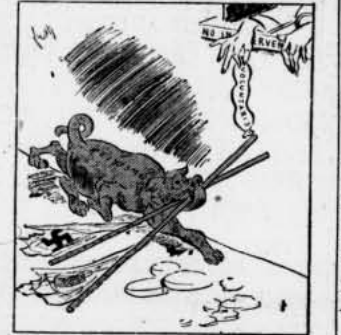
El feixisme. — Si no fos simbòlica...!

ions. En canvi, als cercles dirigitats es considera que Vayda Voj és el candidat que té més possibilitats. Vayda dirigeix l'important front romanés. És possible també que quedi en el govern el partit liberal. Cal aclarir que no es tracta, per ara, d'una crisi governamental, sinó de la qüestió de saber quin és el programa que setima el sobirà més adequat per a la vida del país, vista la situació interior i exterior. —Pàbrs.