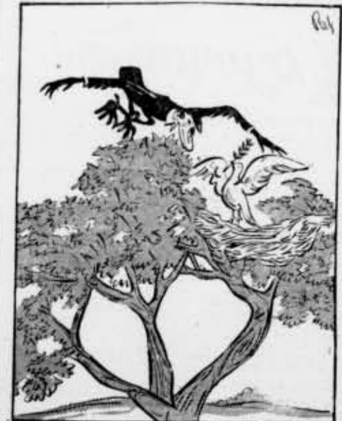
Hitler. — Aci l'únic animal sóc jo. I prou!