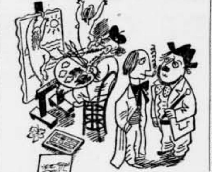
— Si, li agrada pintar banyistes; però com que la mà li comença de tremolar, li surten amb pell de gallina. (De «Candida»)