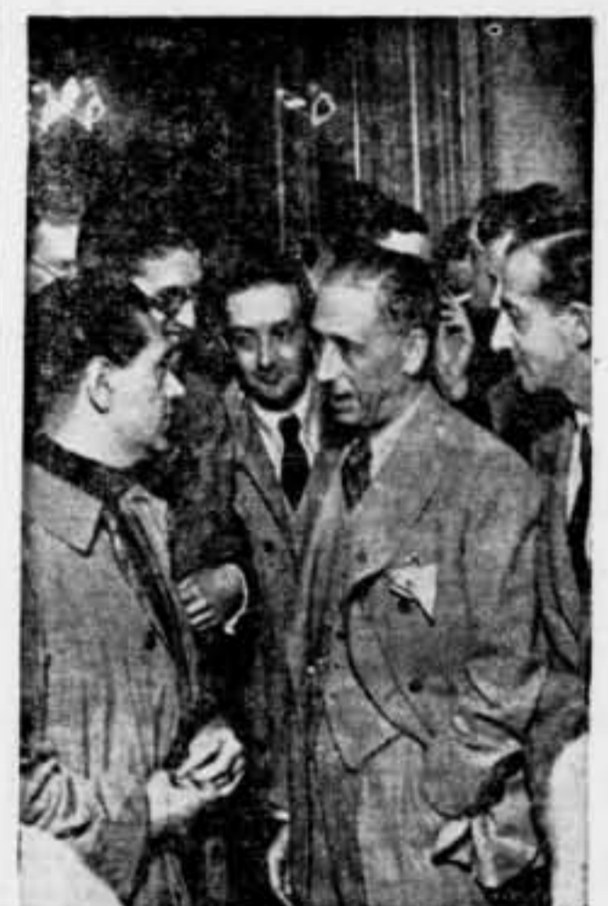
En el seu viatge a Madrid, el president Companys fou interrogat repetidament pels periodistes. En el gravat el veiem parlant amb els representants de la premsa estrangera

Batapest, 8. — El professor húngar Gioergi, que fou laureat la setmana passada amb el premi Nobel de Medicina, pronuncia ahir un discurs davant el micròfon de ràdio en el qual expressa la seva esperança que arribi a triomfar les forces de la pau. «Tots els nostres esforços — diu — foren inútils al hom atones dels nostres descobriments amb finalitats destructives. A la Terra hi ha espai i pa suficient per a tots. El que hom de fer és voler-ne i comprendre'n millor, i crear més en la potència de l'home i constructiva que en la de les armes destructives. — Fabra.