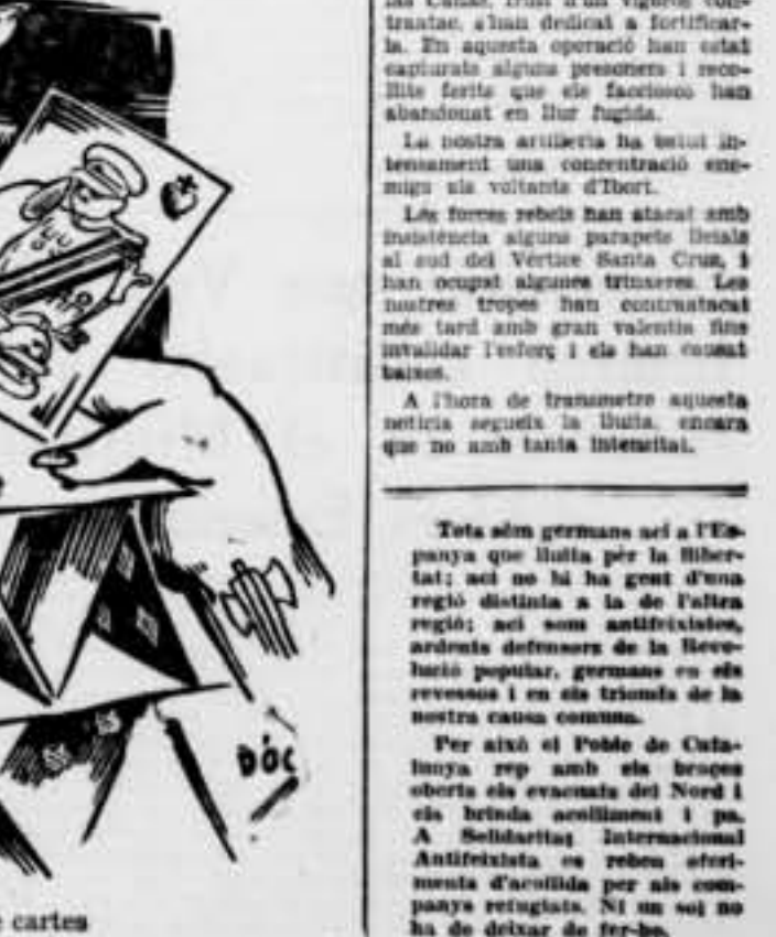
Castells de cartes