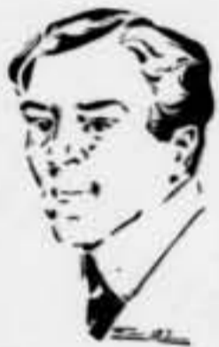
Alexandre de Riquer

Quant a la segona afirmació, n'hi ha prou amb un lleuger coneixement de l'ànima dels qui manen i podríem veure l'últim capítol d'una sèrie de fets que ens porten a la casa de Hitler i de Mussolini en el moment que ens ocupem de la nostra obra.