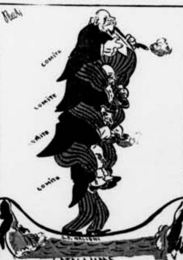
Un número perillós