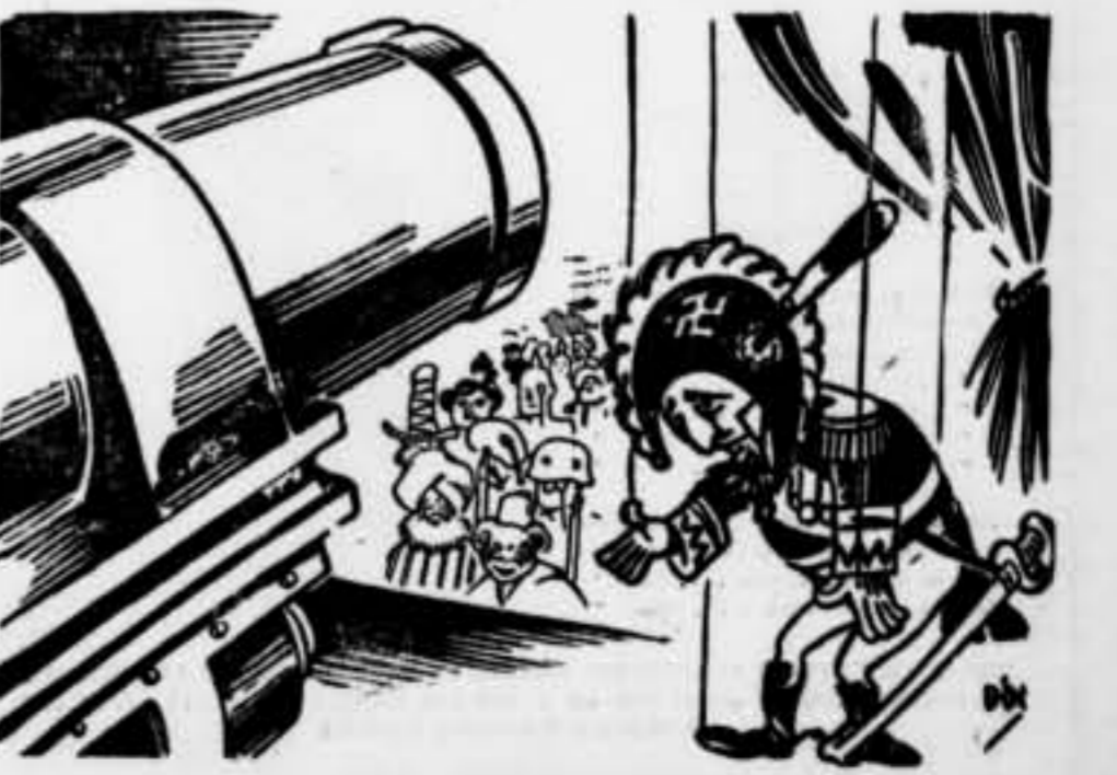
—Si sou servit... Us he preparat molt de menjar.