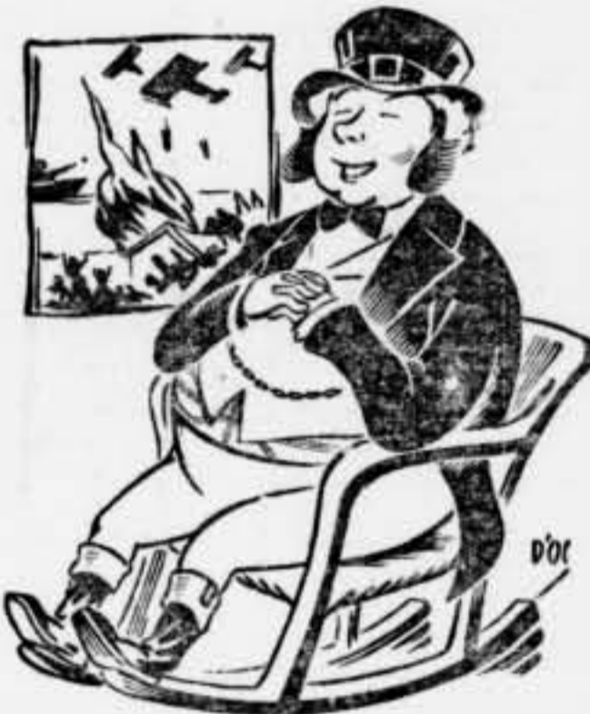
— Espanya encara està molt lluny de la meua India...