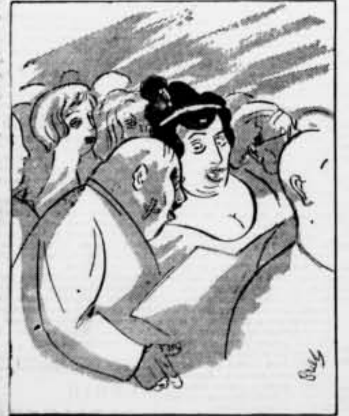
Ella: Coneixeu el «Barber de Sevilla»? Ell: No... M'afaito jo mateix.