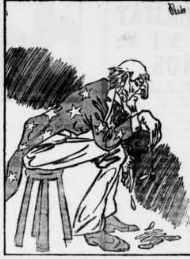
...FERRERES, FERRERES, FERRERES, D'EL...