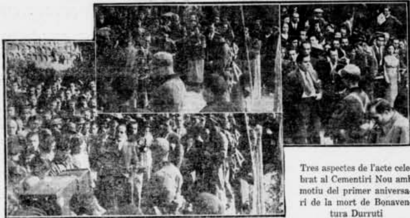
Tres aspectes de l'acte celebrat al Cementiri Nou amb motiu del primer aniversari de la mort de Bonaventura Durruti