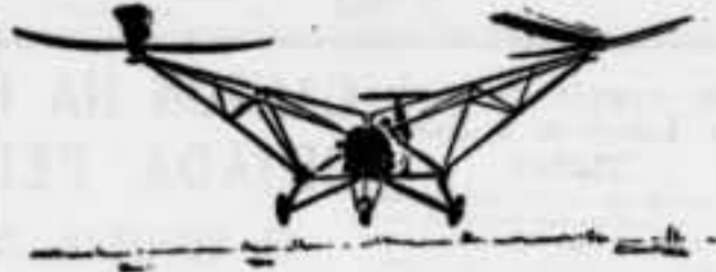
L'helicòpter alemany "F. W. 61", que ha realitzat unes proves interessantíssimes en el terreny de Tempelhof, de Berlín.

Fa una dies parlàvem, en aquestes planes, d'unes proves realitzades amb èxit total, d'un nou tipus d'avió, un aparell del gènere autògiri o helicòpter.