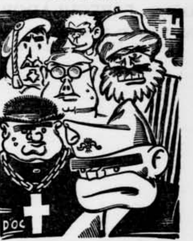
Hi ha qui diu que els feixistes tenen un front extens

para aconsejaros que volváis a vuestras tareas habituales porque si tenís que reclamar en justicia nosotros estamos siempre por ella y estaremos a vuestro lado para defenderla; pero si no es así, la Municipalidad de Barcelona, sin separarse de la autoridad, está resuelta a no degradarse consintiendo este sistema habitual de aflicción en que se pone el país por cuestiones que deben dirimirse como hermanos y con la conciencia y reflexión de gentes morigeradas y sensatas.—Obreros honrados: os engañan pèrfidos instigadores que detestan la causa liberal y al ilustre Duque de la Victoria, y no olvidéis que si triunfáseis por medio de la fuerza no sabríais que hacer de la victoria y acabaríais por ser víctimas de la seducción para llorar estérilmente después un desengaño tardío. Cap al tard del repetit dia 2 de juliol arribà al Pla de la Boqueria, de Barcelona, una manifestació amb una bandera vermella que duia escrita aquesta mots: «Viva Espartero.—Asociación o muerte.—Pan y trabajo.» La bandera els fou presa i la manifestació es dissolgué aviat. L'endemà els obrers s'havien reunit als afuers de la ciutat, i al vespre un grup es dirigí Gualba avall cap a l'Ajuntament,