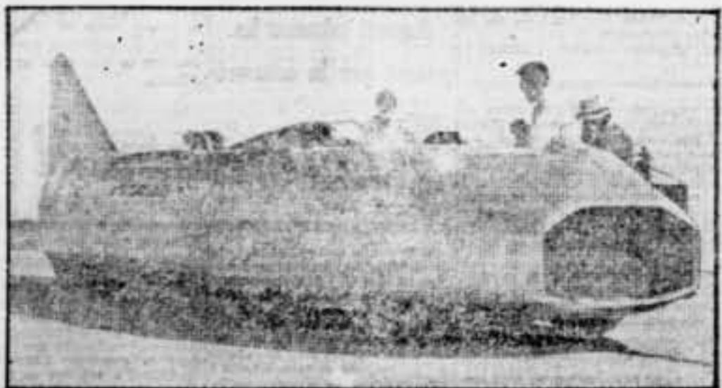
L'estrany vehicle que Eyston ha batejat amb el nom de "Thunderbolt", i amb el qual ha establert el nou record a una marxa horària de 301'974 quilòmetres