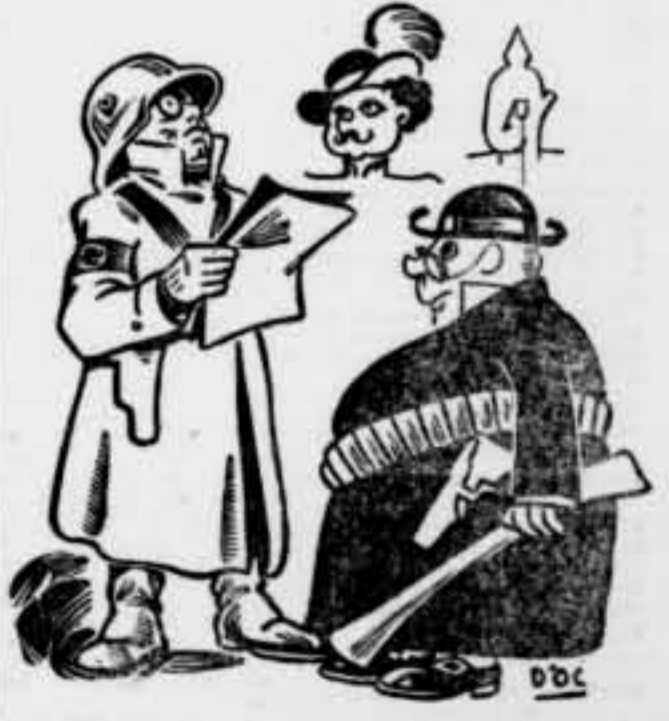
AL CAMP REBEL