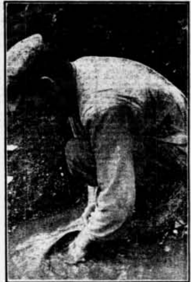
Un obrer de la indústria de l'or, rentant aorex aurífers en un vece de l'Ural

Es bo remarcar que de tota la producció d'or de l'antiga Rússia, només el 5'6 per 100 era extret mecànicament, amb l'ajut de dragues, màquines hidràuliques, etc. La resta era obtinguda mitjançant el treball manual, extraordinàriament penós per als buscadors d'or. Actualment és extrema mecànicament molt més de la meitat de la producció d'or.