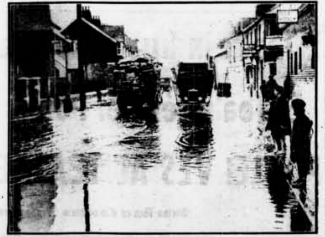
Els aiguats d'aquesta tardor han produït al sud d'Anglaterra una de les inundacions més importants que es recorden. En el gravat veiem uns camions travessant els carrers d'Eastbourne convertits en rieres

KWANGTSEI DES JAPONESOS? Xang-Hai, 30. (Urgent). — De l'Agència Reuter: Els japonesos anuncien oficialment la presa de Kwangtse. — Fabra. (Segueix a la pàgina 3)