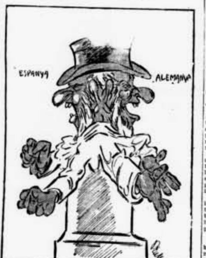
Per un cantó somriu; per l'altre s'enutja