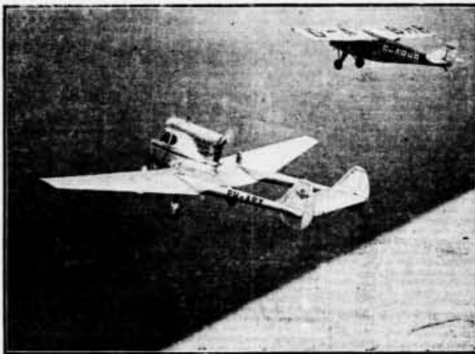
El «tricicle volant» en el seu element

Les tècniques aeronàutiques de tot el món realitzen importants estudis per tal d'augmentar la seguretat en avió, i això a desgrat d'haver aconseguit que el coeficient de seguretat d'un viatge en avió sigui superior al que cobria el risc en viatjar en un tren ràpid.