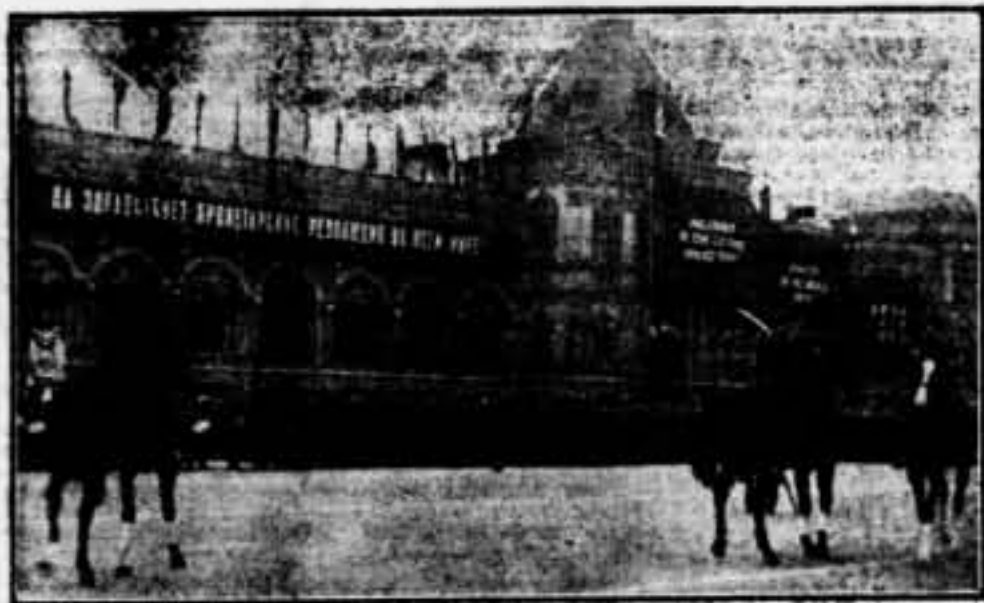
Yorotxilov, comissari del Poble a Defensa de la U. R. S. S. i mariscal de la Unió Soviètica, rep del mariscal S. Budionny, comandant de la gran parada celebrada a la Plaça Roja de Moscou, l'informe corresponent