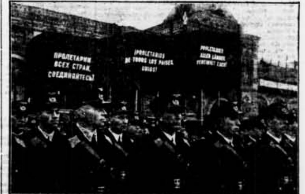
Una columna de l'Aeronàutica abans de la gran parada celebrada a la Plaça Roja de Moscou el dia 7 de novembre

NENS: S. I. A. (SOLIDARITAT INTERNACIONAL ANTIFEIXISTA) organitza el vostre dia, el 6 de gener, com una data en què els homes de tot el Món testimoniaran llur repudi als assassins de nens. Envieu els vostres escrits, les vostres petites obres d'art, els treballs manuals que feu, a S. I. A., que és acollidora de tots els nens. Consell Regional de S. I. A., carrer Nou de la Rambla, 3 i 5, Barcelona.