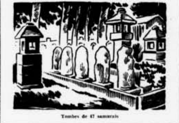
Tombes de 47 samurais