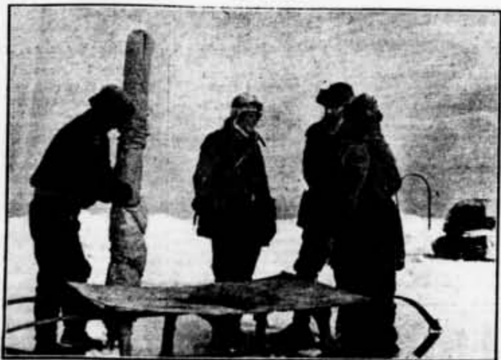
Quatre individus de l'expedició soviètica arriben a un lloc de sojorn. Són, d'esquerra a dreta, Babutskis, Tsvetev (adjunt del Cap de l'expedició), Schmidt (cap de l'expedició) i Papanin.