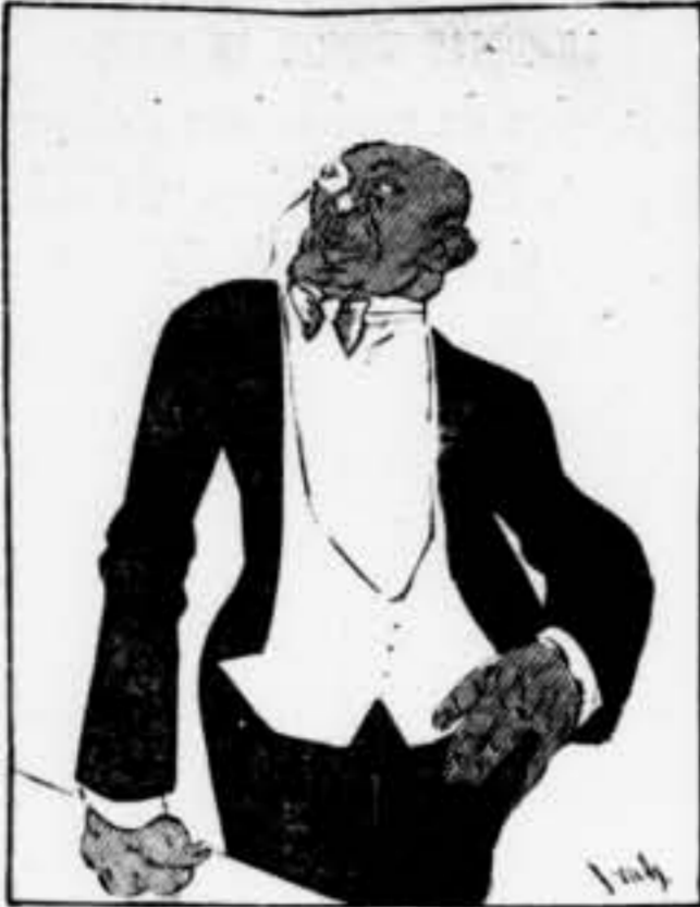
EL PONENT DE FINANCES.—Senyors, hem fet tot el que podem... però... desvems tot el que hem fet.

LA MILLOR INFORMACIO I UN CONTINGUT IDEOLGIC QUE S'ADIU PERFECTAMENT AMB LES HORES QUE ESTEM VIVINT. AIXO ES