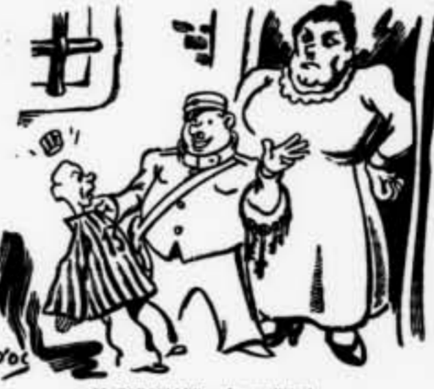
EL CARCELLER. — Ja veu lliure!

prèn que la Revolució francesa, amb el seu esperit simplista, les prohibís. Al capdavant, la societat anònima ha arrelat. Però s'ha depurat. Es molt interessant observar que les que més s'han estimat darrerament han estat les que, darrera l'anònim, han deixat veure qui hi havia — un conseller, un president, etc. — I per més que hi hagi avantatges en l'anonimat, sem- bla que la societat anònima millor és la que no és pura. D'aquí nasqué la transac- ció entre la societat anònima i la col- lectiva: la societat limitada, molt cor- rent a Anglaterra. En aquesta forma d'empresa hi ha els noms d'uns homes com a garantia.