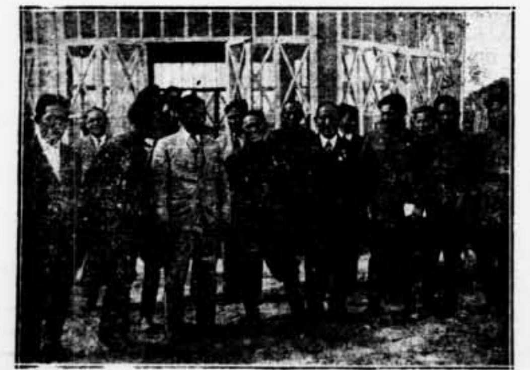
Uns de les República que formen la U. E. S. S. de la de Tanu-Tuva, a l'Orient. En el gravat veiem els membres del Govern i del Comitè Central del partit popular revolucionari de Tanu-Tuva.