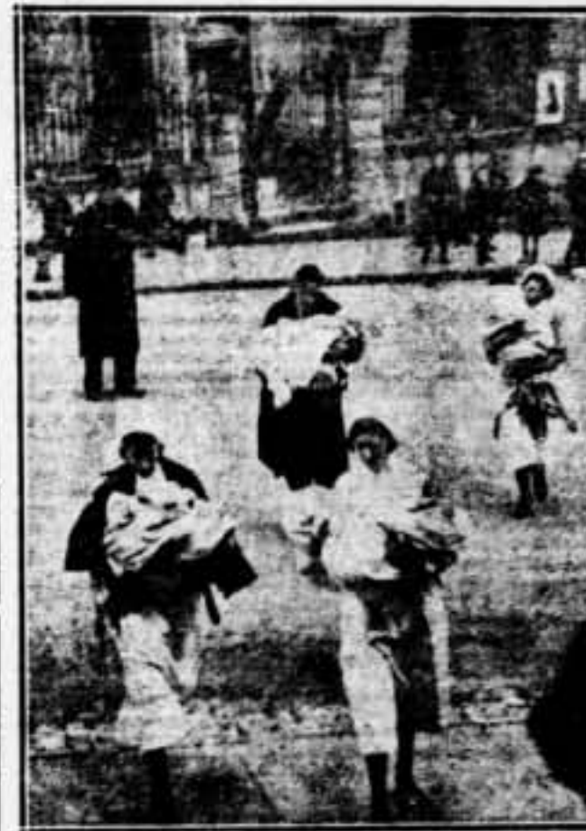
Ha estat a Bristol, infans de poca edat s'han vist arrossegats cap al carrer per les infermeres del sisè batall territorial, a conseqüència d'un incendi que s'ha produït a l'hospital que ocupaven. Sortosament els bombers de Bristol han pogut dominar finalment l'incendi.