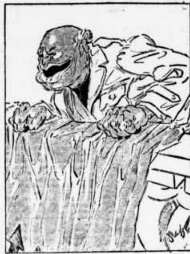
—La Societat de Nacions no ha fet cap esforç per a ajudar les democràcies. En canvi nosaltres veïem per llurs interessos. Una prova ben palesa és la nostra tasca a Espanya.