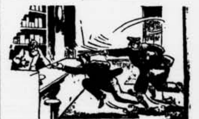
De pressat: De pressat: Doncs-ne alguna cosa contra el mal de cap? (De Bellfloo.) Cosmos.