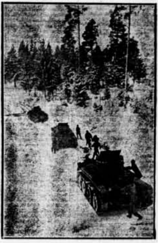
En aquestes dies s'estan practicant a la U. R. S. S. manobres militars d'hivern. En aquestes manobres són utilitzats els taors constants.