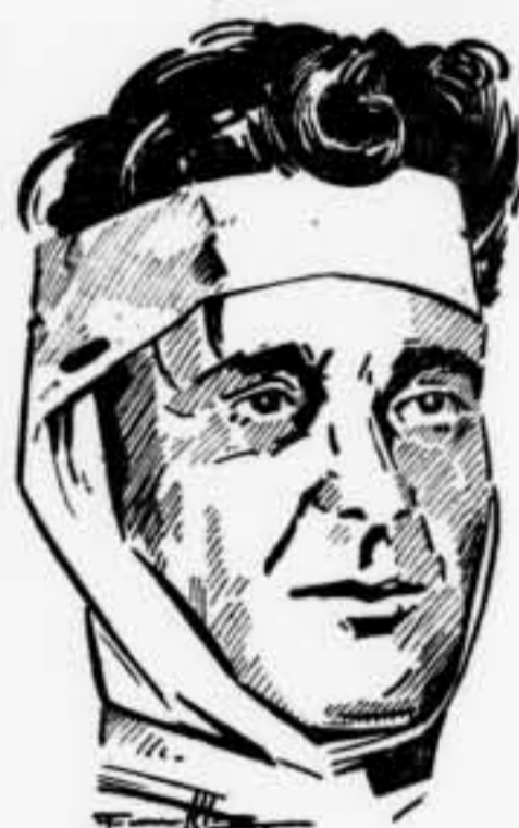
L'alemany Weidmann, autor de sis assassinats, que es sapiga, d'entre els mes d'agost darrer

Propaganda del Reich, Goebbels pot estar més que inflat. Poques sensacions com la que a cada un d'aquests dies han donat lloc a parlar i interessar-se per la cosa d'Alenmany.