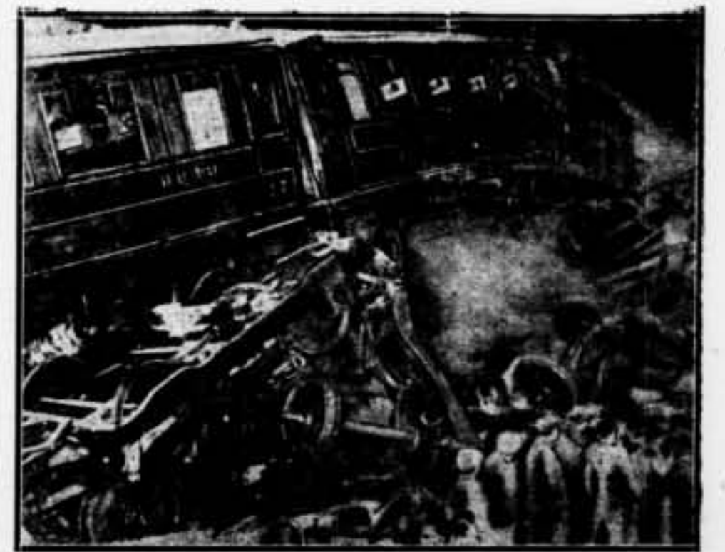
En la nit de divendres passat l'express Edinburg-Glasgow topà amb els darrers vagons de l'express Dundee a l'estació de Cullinstown. A conseqüència de l'accident resultaren 22 passatgers morts i 86 de ferits.