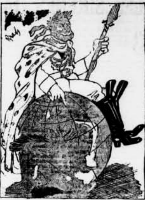
Dominaré el món. Ho afirmo. Encara que es vegi que és una bola