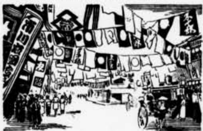
OSAKA: CARRER DELS TEATRES

Al dia abans, els telegrafs han de deixar, encara que sigui de tant es limiti a menjar (com quan-