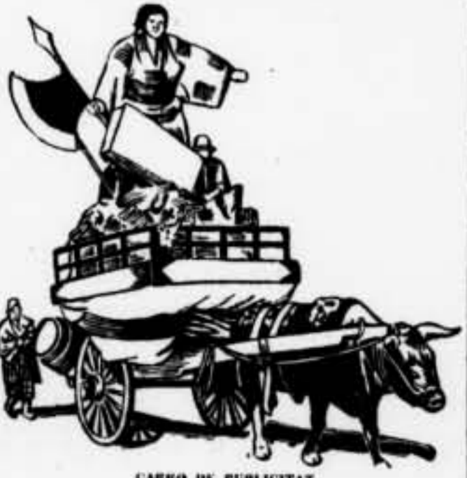
CARRU DE PUBLICITAT

stó sobre el Govern. "Le Populaire", òrgan del partit socialista, s'acosta els obrers que impedeixen la infiltració d'agents provocadors a les seves files, i "L'Ouvrier" s'acosta que no es faci el joc als adversaris. El seanyor Chautemps, en la reunió del grup radical-socialista, ha expressat la seva preocupació, que comparteix en gran manera la majoria del Front Popular.