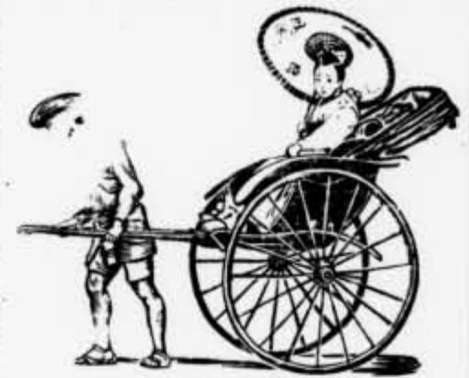
COTXE DE TURISMI

Les mostres de les tendes no són aplicades de pla sobre la paret, sinó projectades en fora com