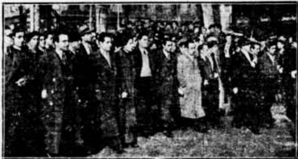
Companyes que ocupaven la presidència del grup de la C. N. T. a la manifestació

A dos quarts de deu comença la manifestació de manifestants als locals assemblejats. Sindicats i partits polítics sortiren de llurs respectives locals per tal d'adreçar-se a l'obra de concentració. Els manifestants havien d'organitzar-se en grups que sortien al passeig de Pi i Margall.