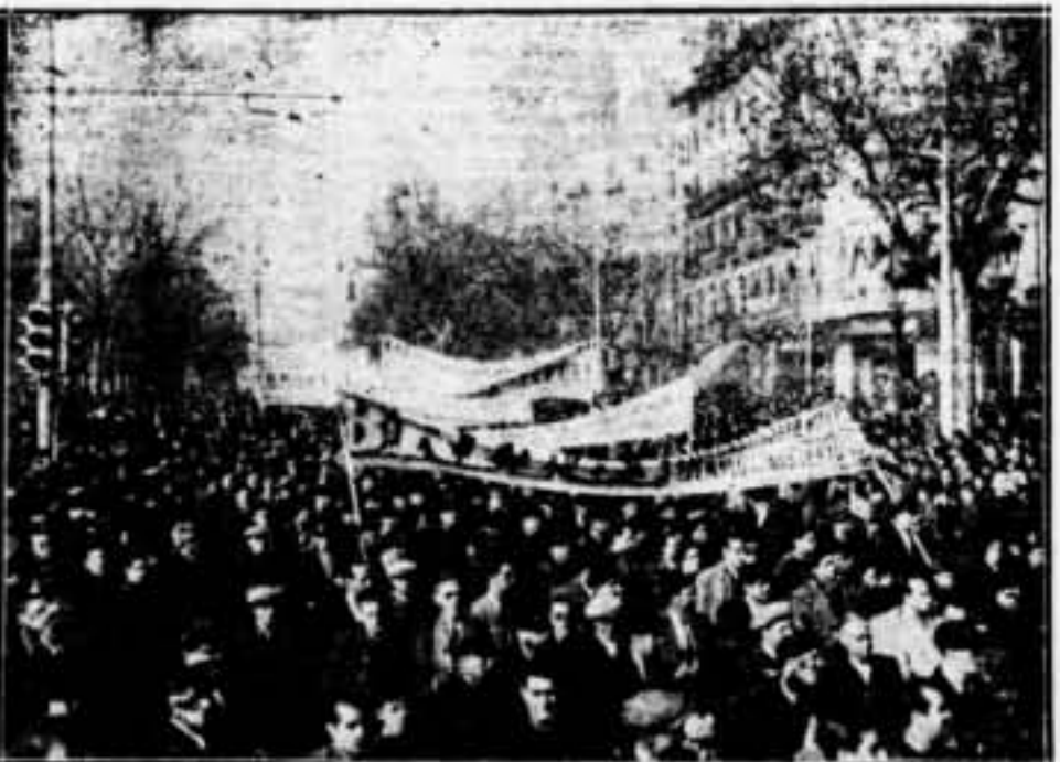
Un aspecte de la manifestació d'ahir

«Primer Terol, després Saragosa, Salamansa i la victòria definitiva. U. G. T. de vendes en els mercats de Barcelona». «Glosa de militants de la C. N. T. Abogant per la unitat obrera, faga de la victòria». «Honor a las víctimas del fascismo. «Vosotros a aplazar el fascismo. Nosotros a combatir en la resistencia. Adelante. Comité Regional de Mujeres Libres». «Heroinas luchadoras. Fiestras mujeres harán que torquen las conquistas revolucionarias del 19 de julio. Federación Local de Mujeres Libres». «Solidaridad Internacional Antifascista de Catalunya saluda a los heroicos combatientes de Terol y recuerda cariñosamente a las pobres victimas de la Libertad». «C. N. T. El Sindicato de Comunicaciones y Transportes de Barcelona delante de la derrota de las huestes fascistas en Terol reñana lleno de júbilo: ¡A ellos! ¡A ellos! hasta la victoria definitiva».