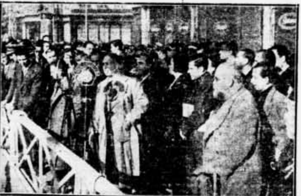
La presidència de la manifestació, a la Plaça de Catalunya

Entre gran nombre de paucos s'aparellaren les següents: «C. N. T. - F. A. I. al Exèrcit Popular. No nos importa si maduram de una derrota, perquè Terol és dies que al final serà el vencedor. «Un nombre: Terol. Una bandera: el nostre del poble». «C. N. T. Sindicato de Asistencia Social e Higiene, al conover la via de Terol por los luchadores del ideal proletario, hace signo pensamiento de Durutti: Poderes retornar a todo menos a la claridad, sindicado Unico de la Distribucion y Administracion. En el Gobierno de la victoria deben representadas todas las organizaciones obreras antifascistas». «La invasión fascista sólo es vencida cuando sea un hecho». «C. N. T. - U. G. T.». «Una es el Govern de la Generalitat, el front i la remorquadora. A un sol front, d'afirmació i de companyia i del comunistes. «Bisbeaga, Belletta, Branca, Te. «C. N. T. Exèrcit Popular». «Comités de Barcelona». «Unita per la victòria». «C. N. T. - C. N. T.». «Ofensiva l'antagonisme el covardia, però la fan en heroica, glòria a nostre Exèrcit Popular, i fora els covards i els traïdors, forjadors del crim». «Terol ja es llure del seu feixista». «F. A. I.». «Vives l'Exèrcit Popular! Vives el Govern de la Generalitat! Vives el Govern de la República!».