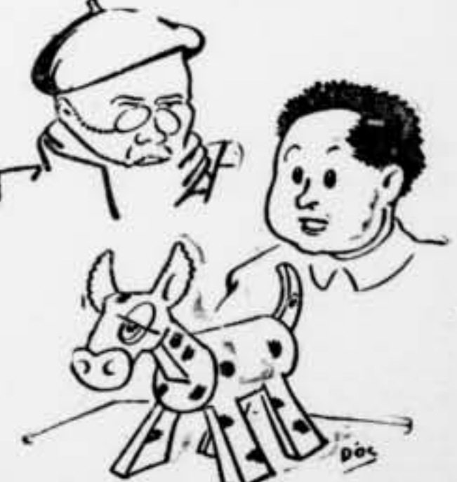
¿Qué es, pare, aquest burro?... ¿Un bou o una cabra?...