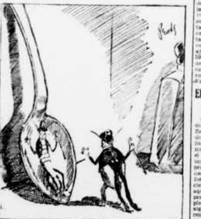
Trobo que he millorat.