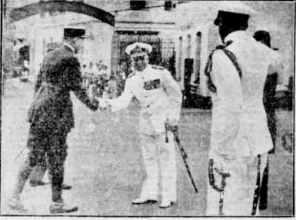
Comandants de les tropes franceses de la concessió internacional de Xang-Hai saludant els oficials d'un vaixell britànic arribat a aquelles aigües per a protegir els súbdits de l'imperi britànic que es troben a la concessió internacional.