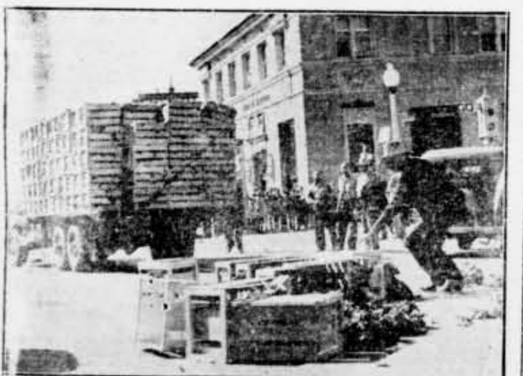
ls agricultors que estan en vaga a la regió de Salinar (Califòrnia) han agut aldarulls seriosos. Els ensiam d'un camió que es dirigia al mercat són estesos per terra i fets malbé.