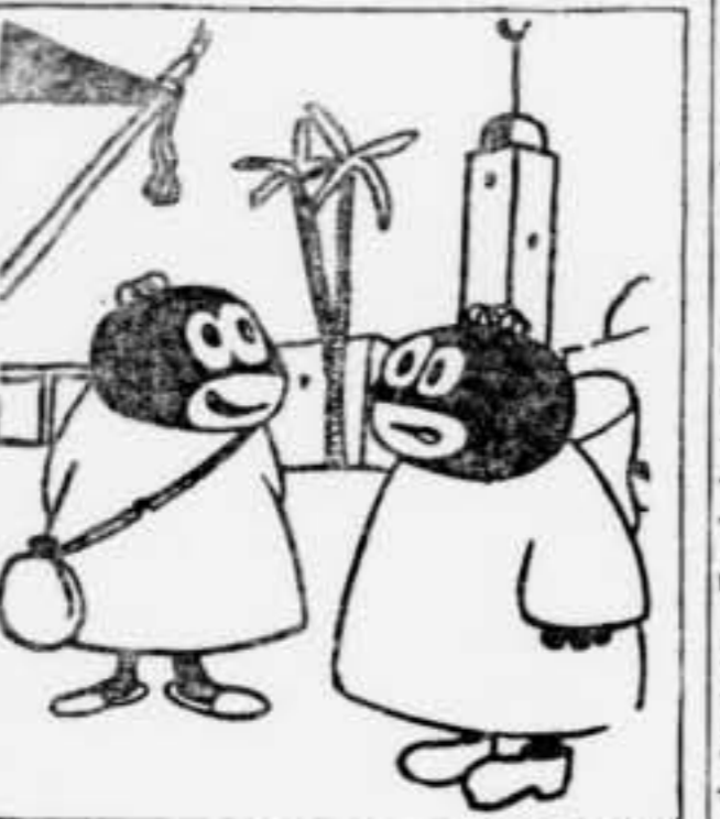
— Veig a la Mesquita en cercle de canel. — Ah, sí, sí, sí, ja m'heu veig el consolat italià a cercar una mica de pèl.