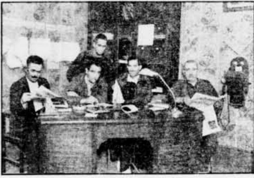
Companys que formen la Junta de la Collectivitat de Camperols, reunits en el seu despatx