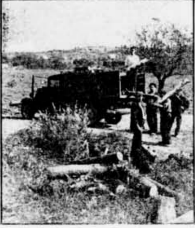
Collectivistes de la Secció de Bosc, dedicats a les tasques que els són encomanades