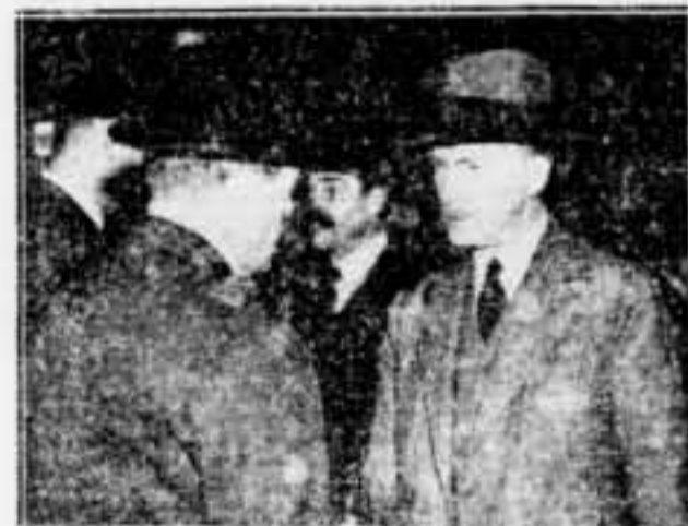
A França i Palestina, el general Dill parla amb el general...