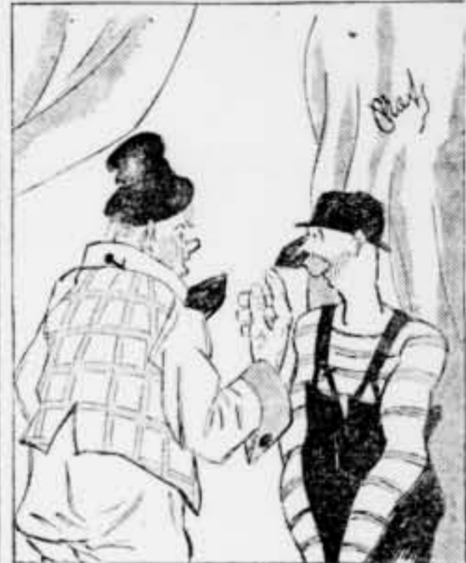
— No sé què hi fa. Per més simplicitat que diguen ningú no s'hi va. — Hebe! Com vols que teu gràcia si tuhom ja està acostumat a les converses diplomàtiques?

LA POLÍMICA DE GUILLEM II Alemanya ha servit sempre a... Res no la canviat, podria dir... Una carta secreta