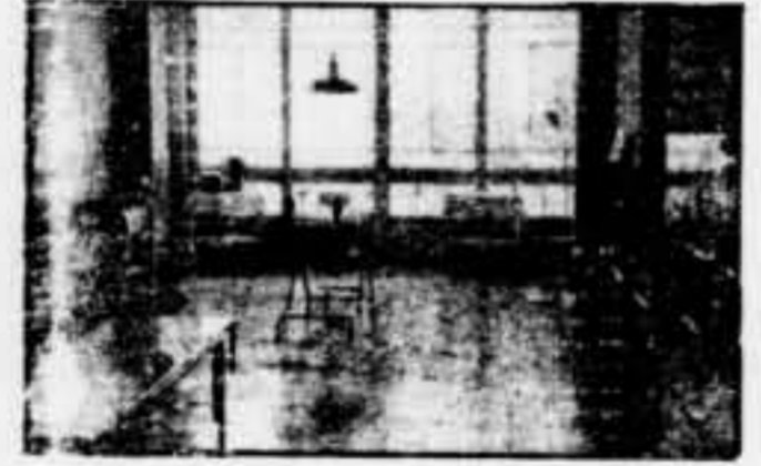
Clínica de Maternologia i Pueri-cultura. — Part de la sala d'intervencions

ció del qual es considera absolutament primordial l'atenció d'un