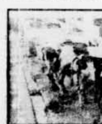
Vista parcial de la granja de qualques de la Granja Municipal de Producció Lliure