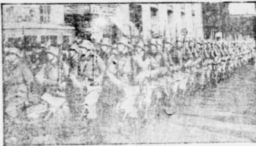
Una de les condicions essencials i que tota mena de manifestacions revolucionàries, el que cal és l'exemple.