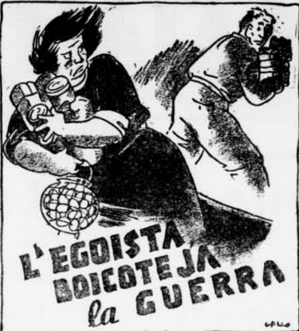
L'EGOISTA BOICOTEJA LA GUERRA