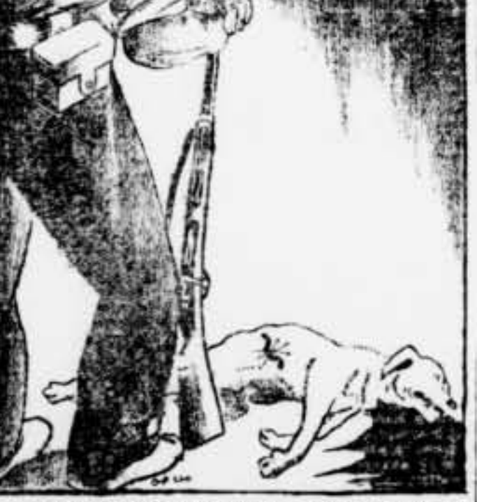
— Els tretze punts s'enclouen en un: «mort el gos, morta la ràbia».