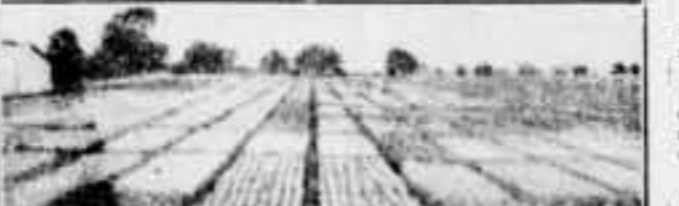
Ens plau més qui cerca el progrés amb els sembrats de blat...

Alvarez del Vayo ha dit: «Espanya només demana el restabliment pur i simple de les disposicions ordinàries del Dret internacional comú»