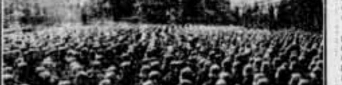
...que no aquells que sembren el Món de casc d'acer.