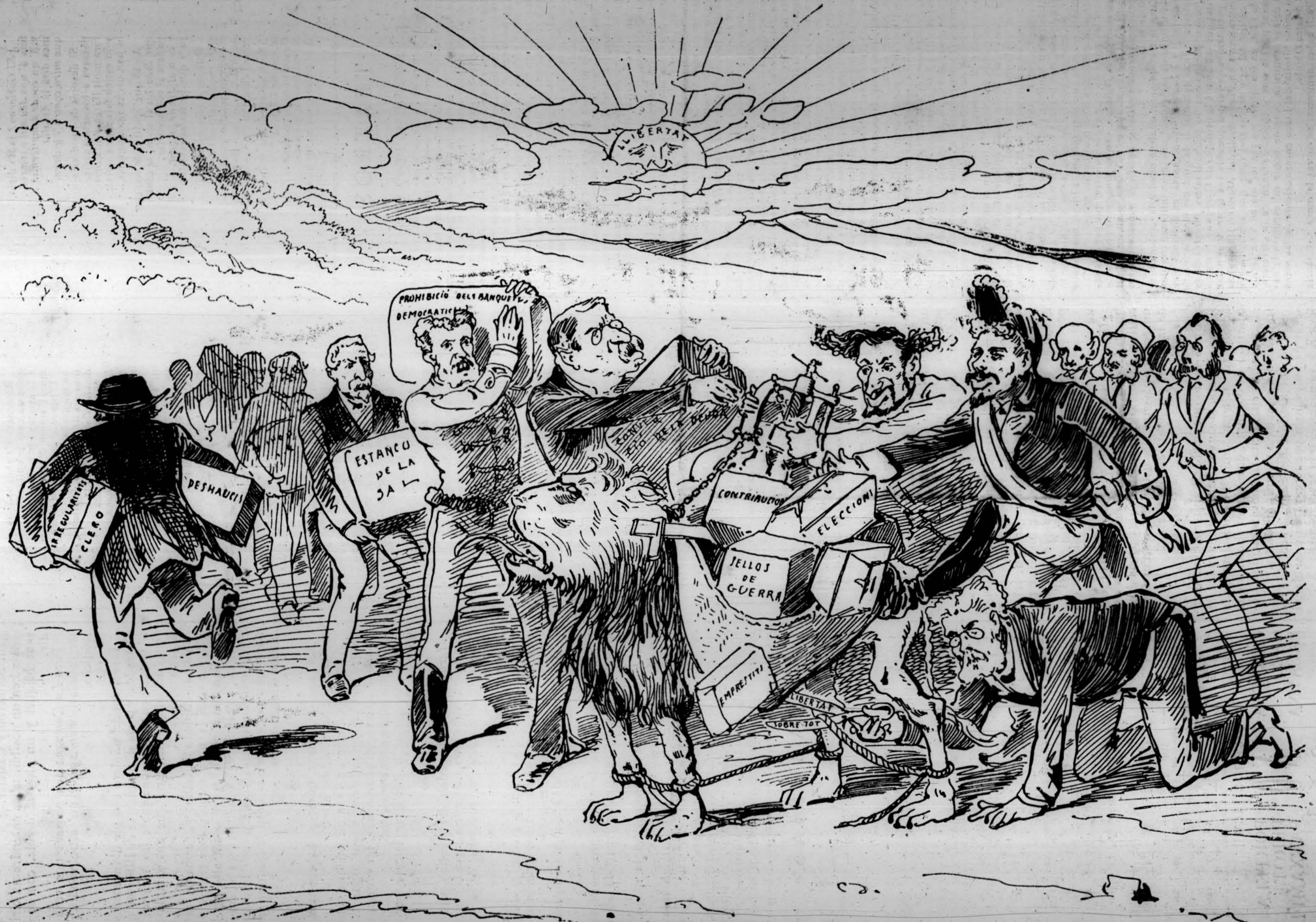
LA FEYNA D' EN JA-FÁ