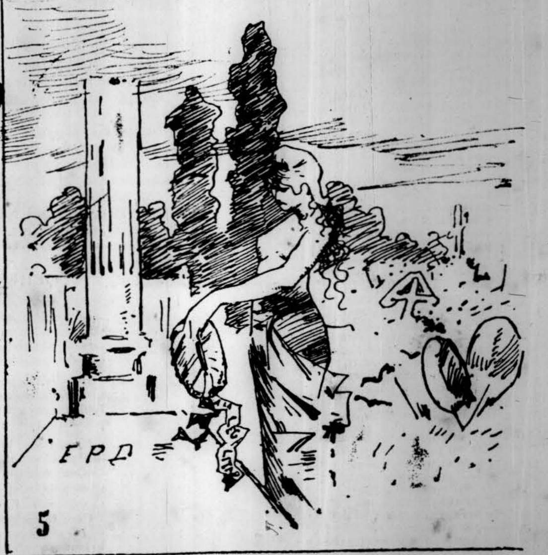
N.º 1. Adictes. — 2. Animació electoral. — 3. Duas cédulas iguals: ¿qui serà l' elector? ¿qui serà 'l Gutierrez? — 4. ¡S' acabat l' arròs! — 5. A la Legalitat.