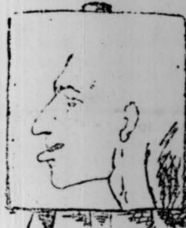
Ja va sortint