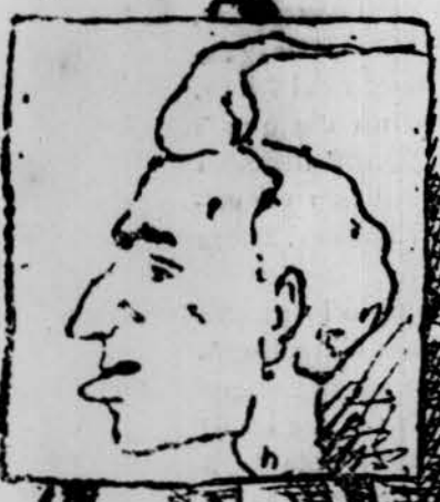
¡Calla! femlhi una perruca