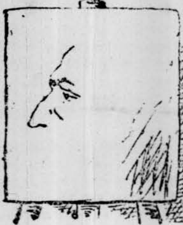
Y l' uil