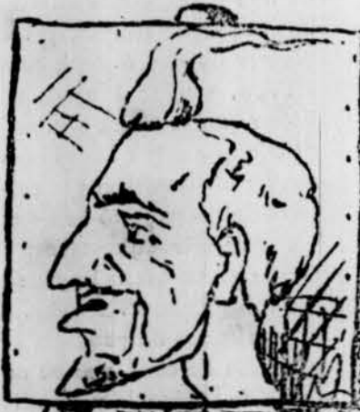
Ja l' tinch; ¡qu' es lleig!