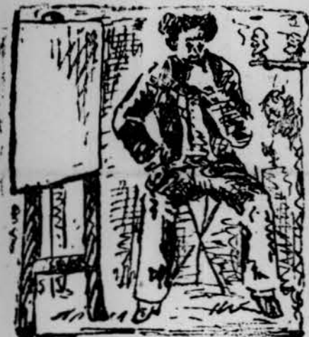
Vull recordar un tipo