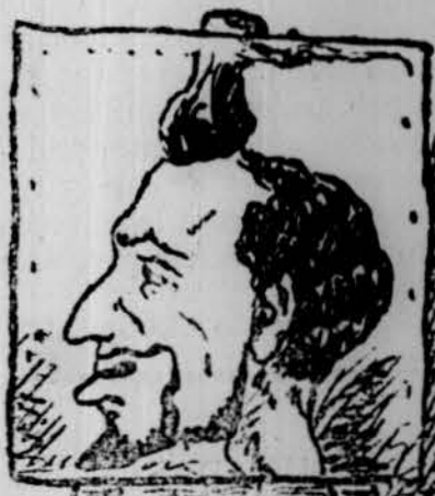
Malviatje; ¡ell no hagués sortit!