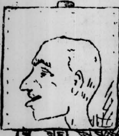
Aixó es un sagristá; no es ell