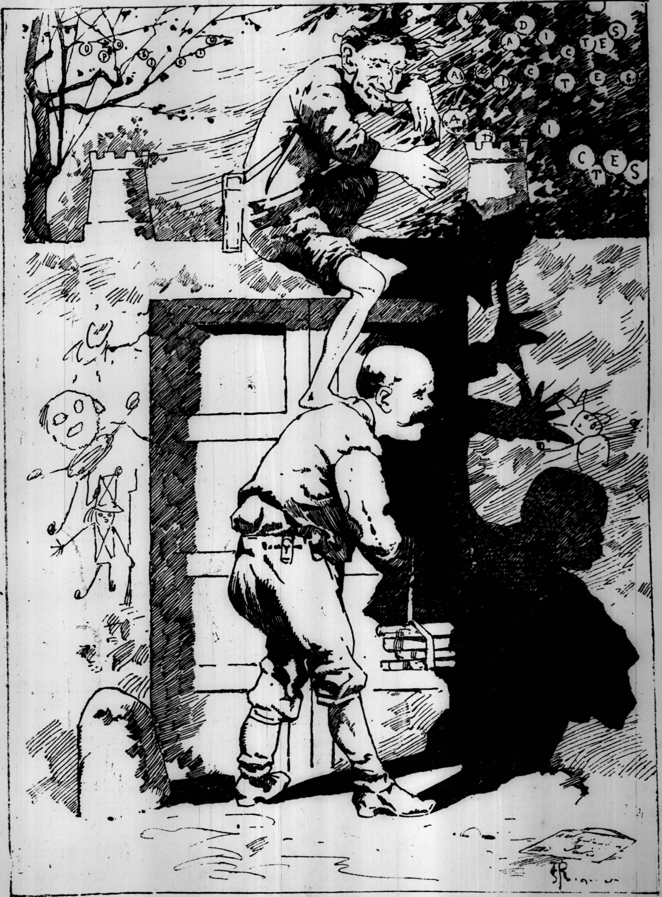
—¡Aguanta, home! (Me sembla que l' hi amagaré l' ou)