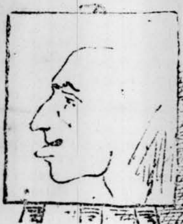
Faltan las orellas