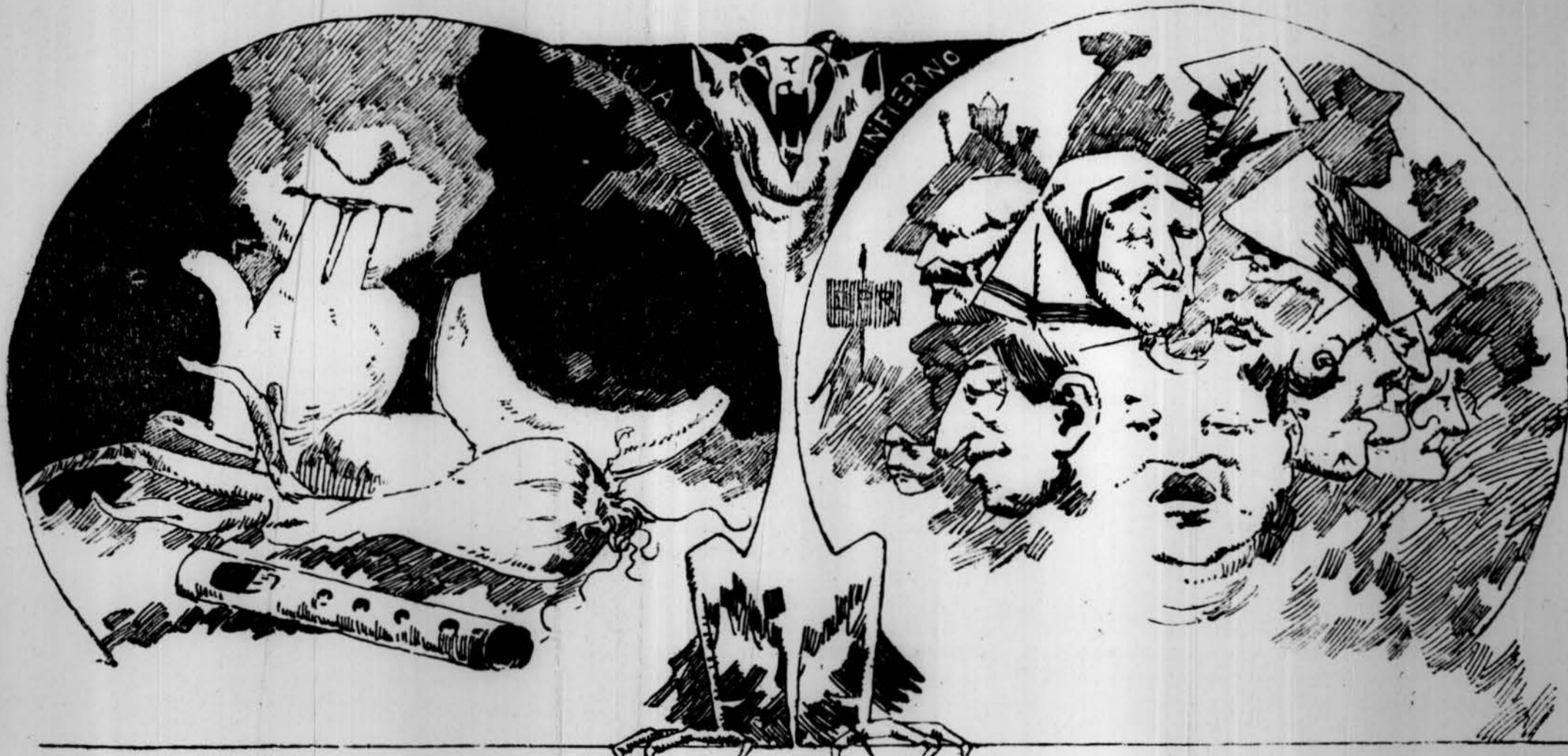
Ovació avans del embarch, en l' embarch y després del embarch