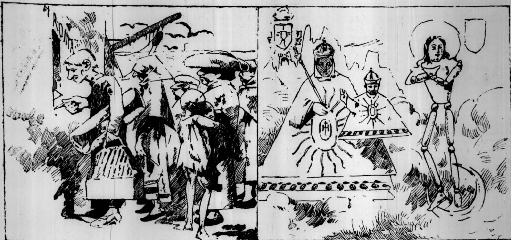
Per deu duros ensenyan al papa