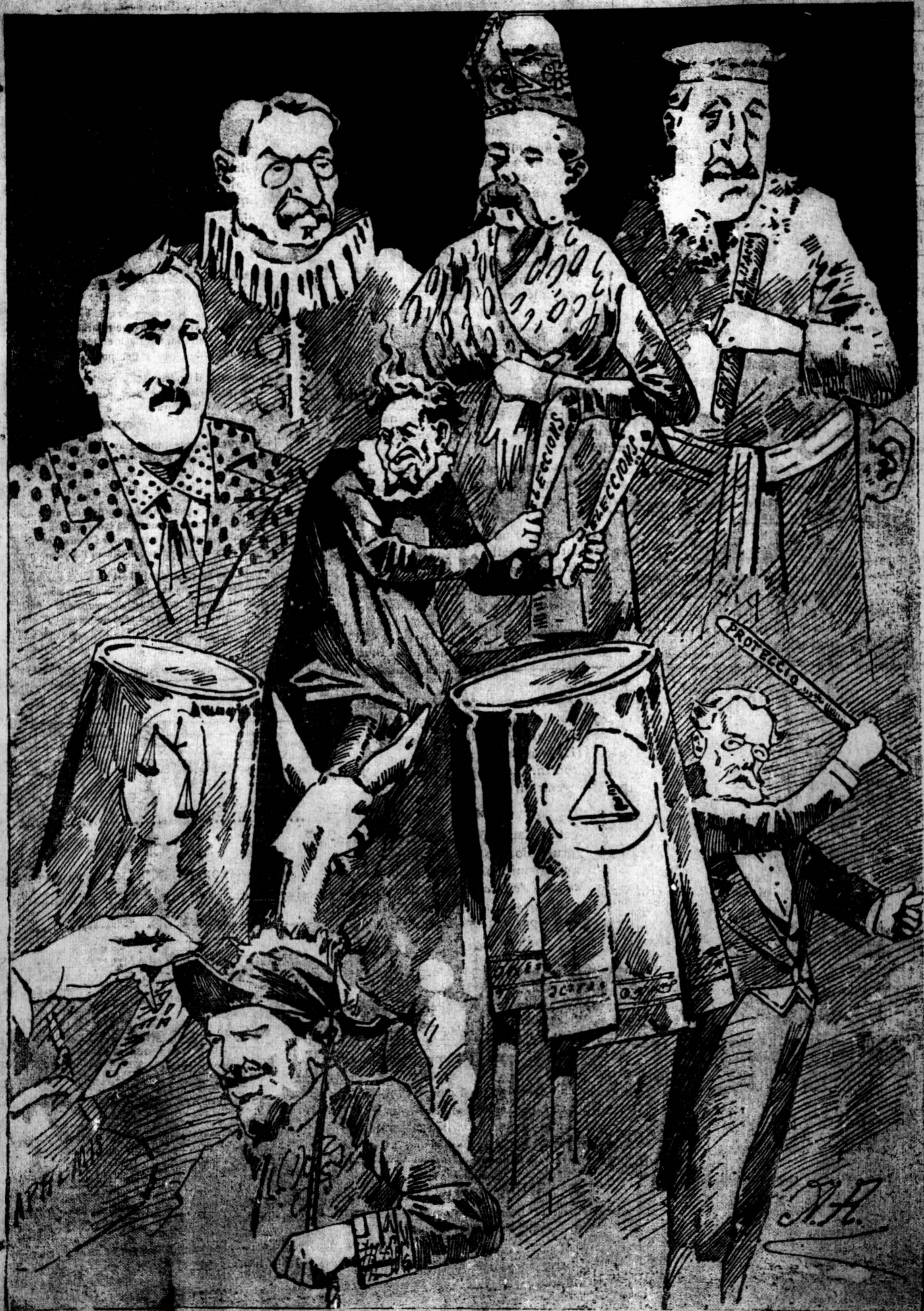
Los uns van ab las trampas y 'ls altres fan los gegants