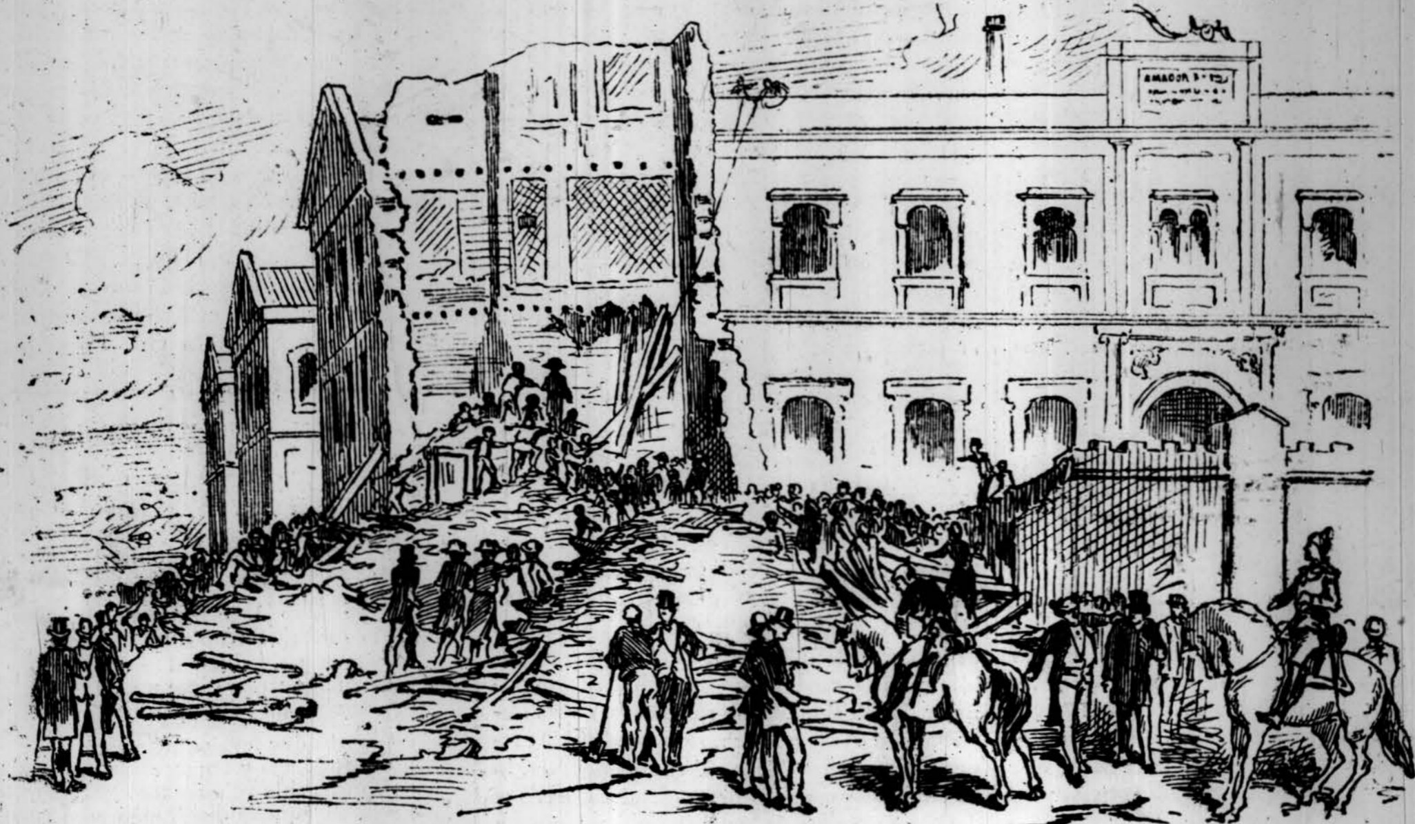
PRESA DEL NATURAL PER UN DE NOSTRES REDACTORS